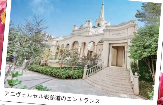
アニヴェルセル表参道のエントランス

「最高のプラセンタ」にぴったりの華やかな会場で 開発者の熱い想いに耳を傾けそして、一緒に “美容” を楽しみましょう。 加工されていない、新鮮な “生” の情報を あなたの感じるまま発信して頂ければ幸いです。